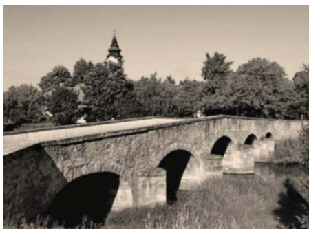
84. ábra – 1841-ben épült Köhid Jászdózsán 1940-ben és 2017-ben

A közúti-, vasúti- és gyalogos hidak a két folyó, a Zagyva és a Tarna vize fölött a települések és településrészek közötti kapcsolatokat biztosító tájelemei. A folyóvizekhez is kötődő közlekedéstörténeti emlékek az ősi átkelőhelyeken lévő hidak. Országosan is ritkák a ma is használatos boltíves kőhidak – szép példák az 1806-ban épített jászberényi háromnyílású és az 1813-ban épített jászdózsai ötnyílású (84. ábra). Évszázadok óta fontos kapcsolatok őrzői a gyalogos fahidak (Jásztelken, Jászberényben), amelyek szükségszerű felújításáról időről-időre gondoskodnak a települési közösségek. A jászdózsai kishíd sajnos mára megsemmisült, így évszázados kapcsolat és egyben tájérték veszett el.