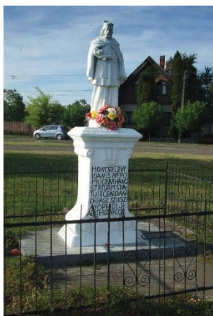
87. ábra – 1784-ből származó Nepomuki szobor Jászapátin (1980-ban felújítva)