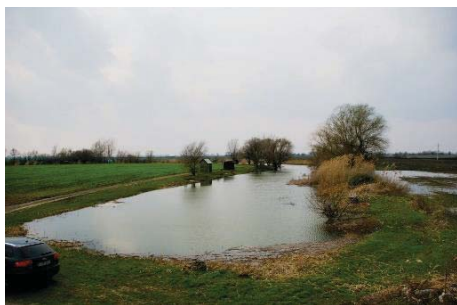
85. ábra – Zagyva-holtág Jásztelek agrártájban, horgászvízként hasznosítva