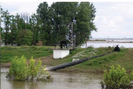
91. ábra – Belvíztemelő kettős zsilip Jászberényben a Zagyva védőgátján