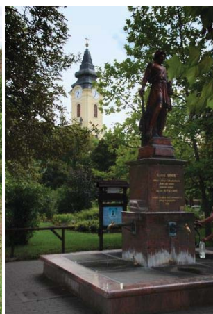
89. ábra – Jászok-kútja Jászdózsán