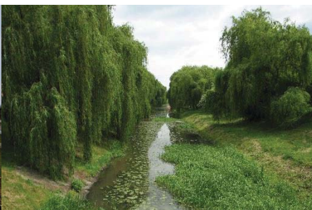
86. ábra – Városi Zagyva, Jászberény városbelső, zöldfelületi elem