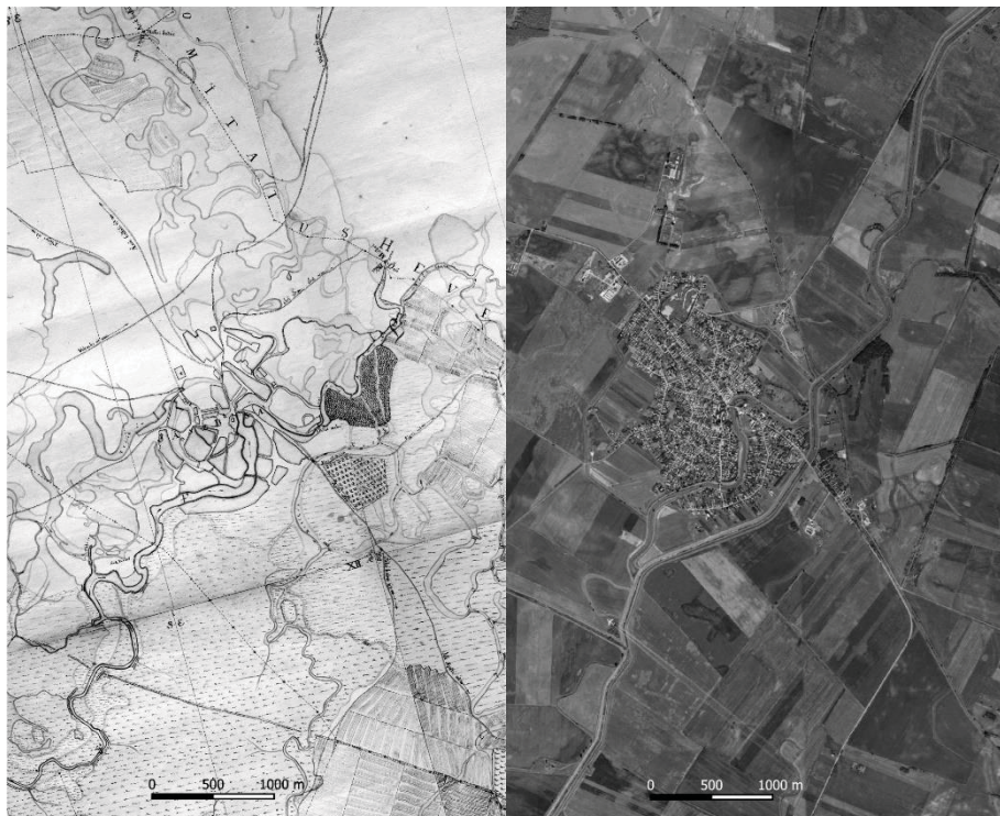
83. ábra – Jászdózsza felszíni vízrendszere a Tarnával a Bedekovich-féle térképen 1791-ben (X.XI.XII.XIII szelvény részlet) és Google Earth felvételen 2019-ben

A vizekhez kötődő tájhasznosítás és tájalakítás történetéhez feldolgoztuk a korabeli térképanyagokat. Közülük külön is említést érdemelnek Bedekovich Lőrinc térképszelvényei, amelyek híven és részletesen bemutatják a 18. század végi jászsági vízrendszert (83. ábra).