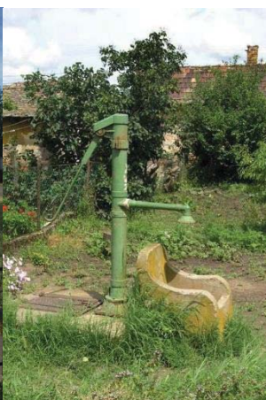
88. ábra – kéziszivattyús artézi kút Pusztamonostoron