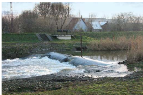
90. ábra – „Külső-Zúgó” Jászberényben az új Zagyva mederben