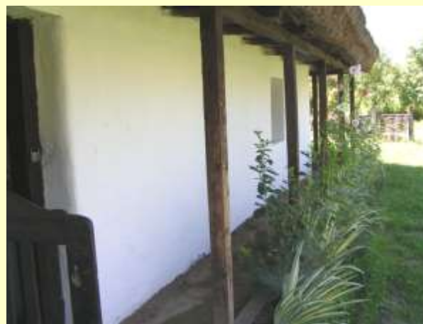
rózsa és búzavirág