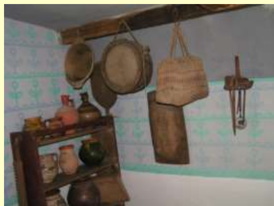
mályvák és íriszek