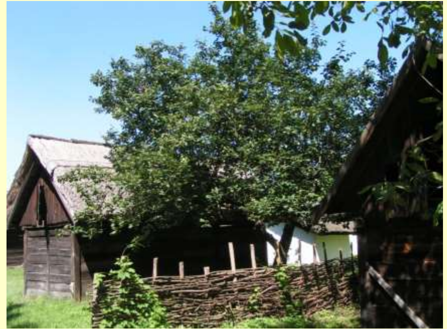
Dió, szilva, birs