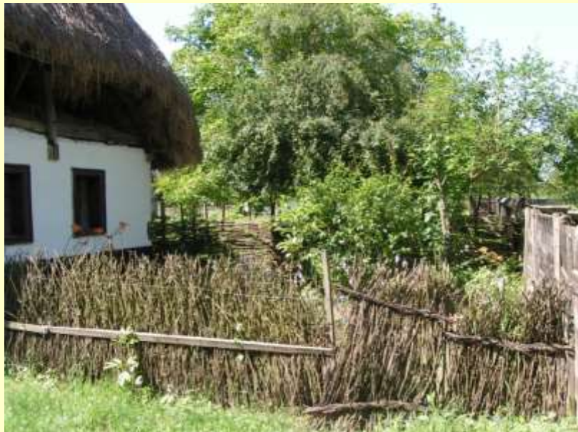
Szarkaláb, sásliliom, árnyékliliom az előkertben. A kis diófa már nem való ide.