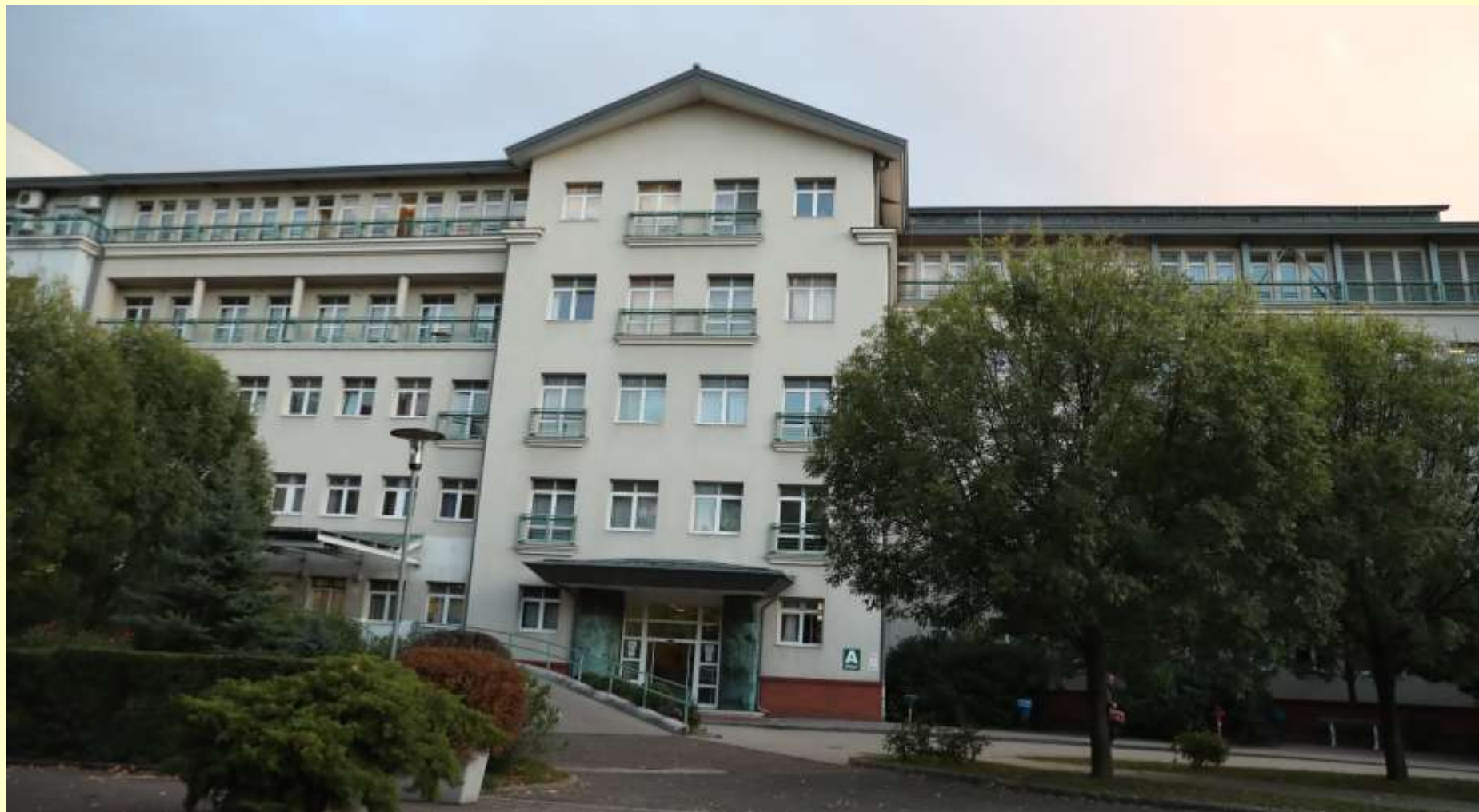
Budapest, Szent Imre kórház