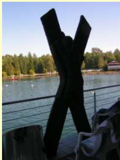
Szent András szobor