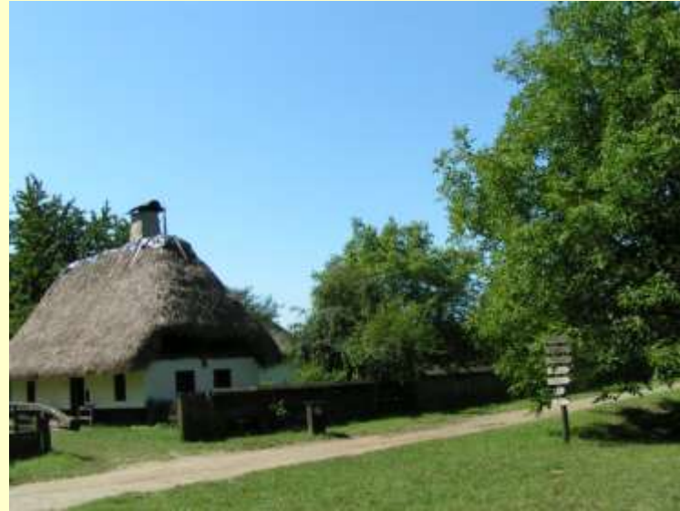
Diófák a falu utcáján