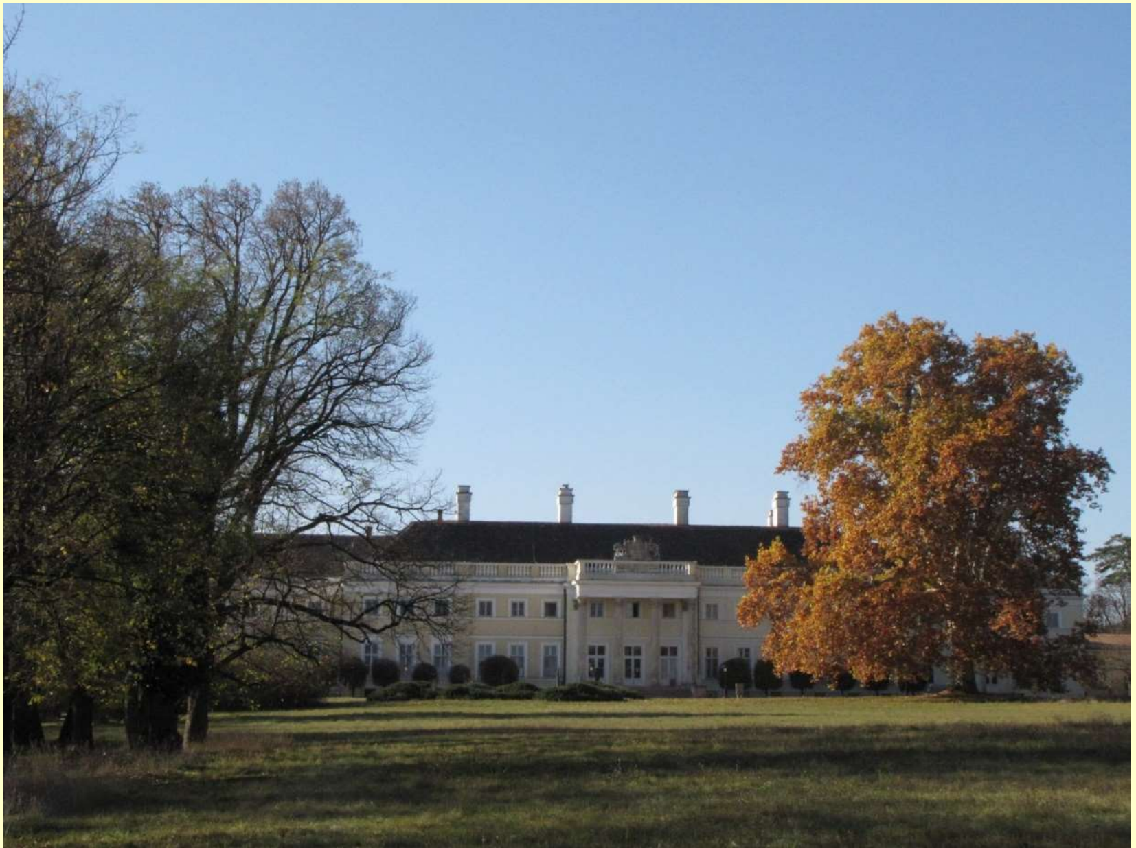
Csákvár, Eszterházy-kastély: Fejér Megyei Szent György Kórház Csákvári Intézete