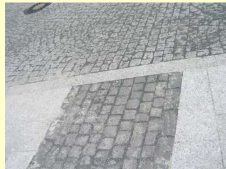
Virágágy helyett burkolat!