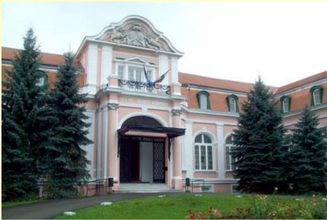
Komárom, Solymosi-Gyürki-kastély: Selye János Kórház