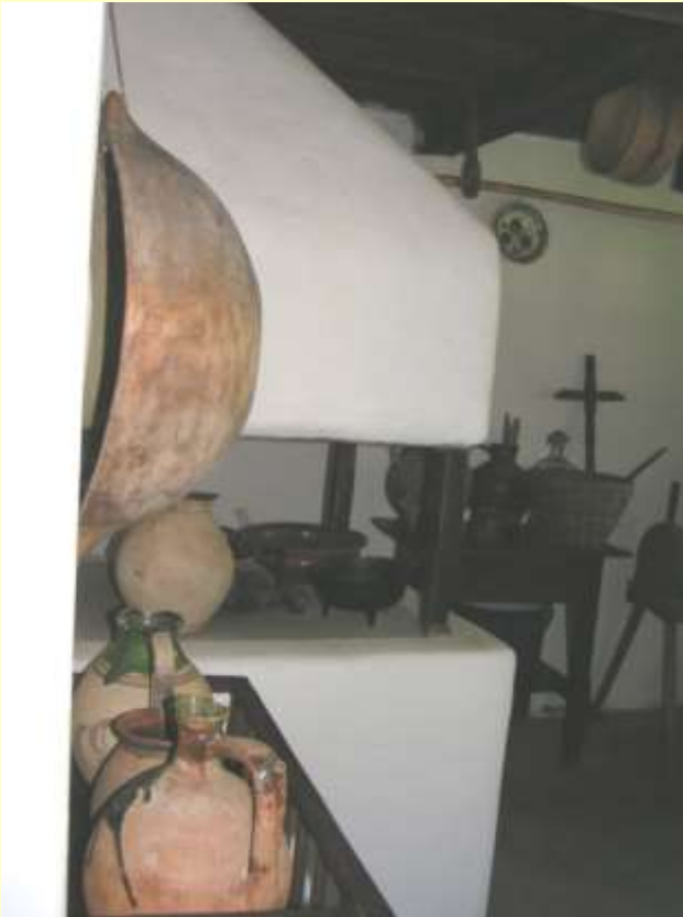
Istálló épület cseresznyefával